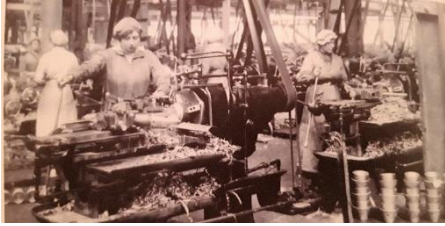
(Povijest 7, Agičić, Koren, Najbar-Agičić, Profil, Zagreb, 2007.)