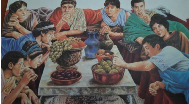
POVIJEST 5, Udžbenik za 5. raz. OŠ; ANTE BIRIN, ABELINA FINEK, DARKO FINEK, EVA KATARINA GLAZER, TOMISLAV ŠARLIJA; ALFA, ZG, 2019.