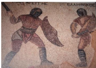
Povijest 5, udžbenik za 5. raz. OŠ; BIRIN, FINEK A., FINEK D, GLAZER, ŠARLIJA, ALFA, ZG, 2019.