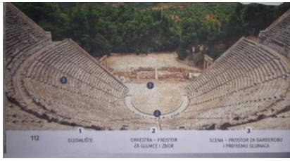
Povijest 5, udžbenik za 5. raz. OŠ; BIRIN, FINEK A., FINEK D., GLAZER, ŠARLIJA, ALFA, ZG, 2019.