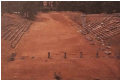
Stadij (Epidaur); foto Mladen Tomorad, 2016.